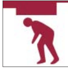
Toeau isel Low headroom