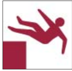
Disgynfeydd peryglus Unprotected drops