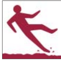
Lloriau anwastad neu lithrig Uneven or slippery surfaces