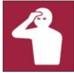
Rhowch gyfle i'ch llygaid ddod yn gyfarwydd â'r golau-mannau tywyll Please let your eyes adjust to the darkness