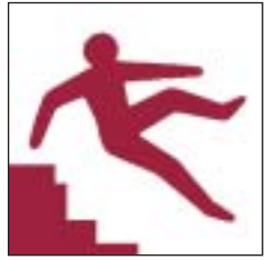
Grisiau anwastad, serth a chul Uneven, steep or narrow stairs

Ceir rhai o'r arwyddion rhybudd canlynol, neu bob un ohonynt, ar y safle hwn. Some or all of the following warning signs can be found situated around the site.